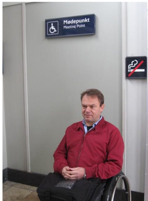
Fig. 4 - Mødepunkt

Der er i gulvet ledelinjer for blinde og stærkt svagsynede. Disse linjer er imidlertid ikke udført konsekvent og er således f.eks. ikke afsluttet med et opmærksomhedsfelt før trappen.