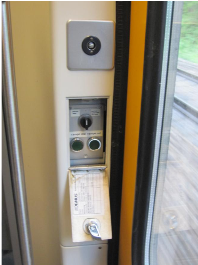
Fig. 13 – Betjeningspanel til rampe

Jeg går umiddelbart ud fra at transporten af en kørestolsbruger i et schweizertog – som normalt forudsætter brug af togets indbyggede rampe – ikke kræver forudbestilling af handicapservice, jf. pkt. 4.2 ovenfor, men at en sådan rejse kan foretages spontant blot ved henvendelse til togføreren på det pågældende tog fra perronen. (Jeg henviser i denne forbindelse også til pkt. 4.1 ovenfor om DSB's oplysninger på hjemmesiden under "Tilgængelighed").