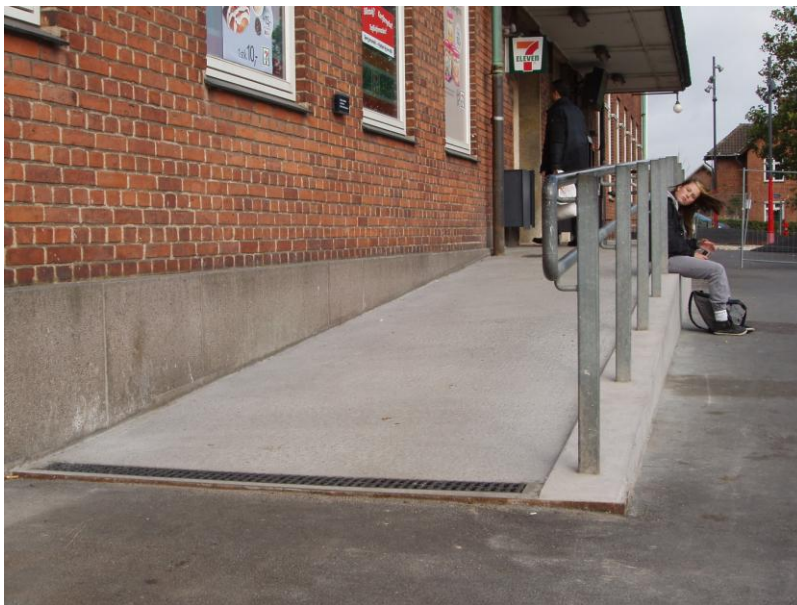
Fig. 2 – Ny rampe

Folketingets Ombudsmands handicapkonsulent har den 5. oktober 2011 foretaget en besigtigelse af rampen, der nu fremtræder som det fremgår af illustrationen nedenfor.