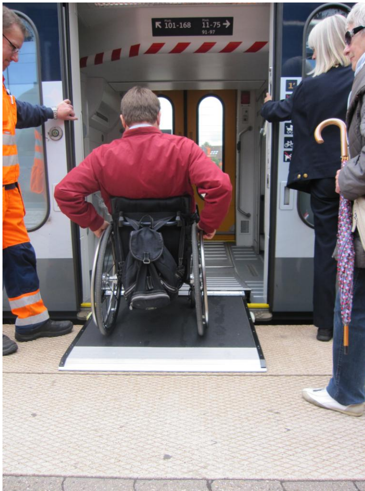
Fig. 12 – Adgang med den indbyggede rampe

Enkelte kørestolsbrugere vil på grund af det sænkede gulv ved indgangen til toget selv kunne køre ombord med kørestolens forhjul løftet. Langt de fleste vil dog nødvendigvis skulle bruge togets indbyggede rampe.