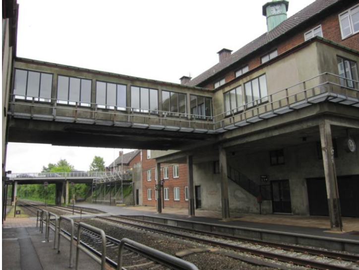
Fig. 10 – Sporovergang mellem perron 1 og 2

Der er kun én elevator på stationen. Adgangen for kørestolsbrugere til perron 2 opnås således via en overgang over sporene.