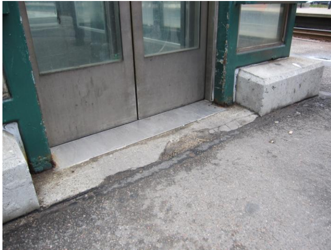
Fig. 20 – Adgang til elevator

Elevatorene giver mig ikke grundlag for yderligere bemærkninger bortset fra den dårlige luft (den tilsyneladende uundgåelige lugt af urin).