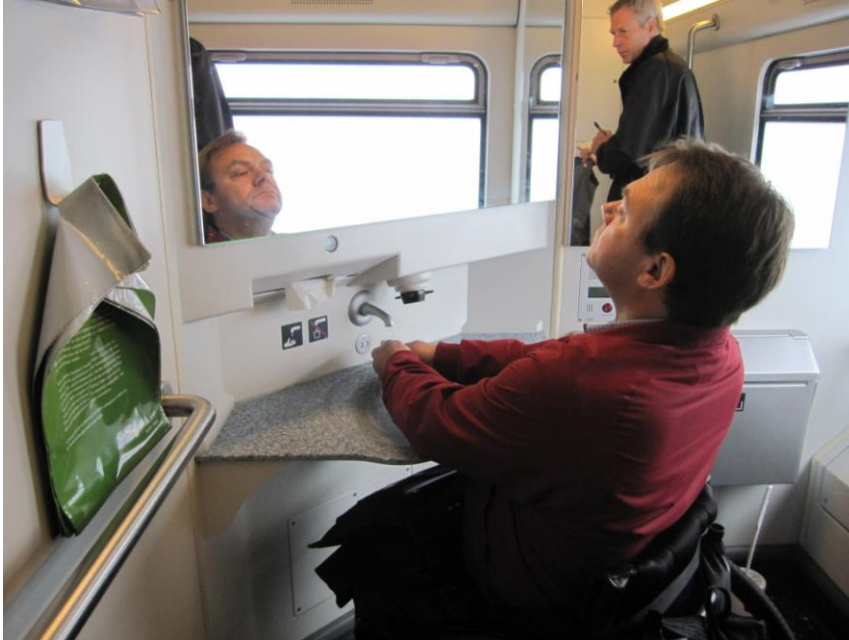
Fig. 19 – Spejlets placering

Spejlet sidder en anelse for højt (101 cm over gulvet), men der er – som det også fremgår af illustrationen nedenfor – et lavere spejl til højre for vasken.