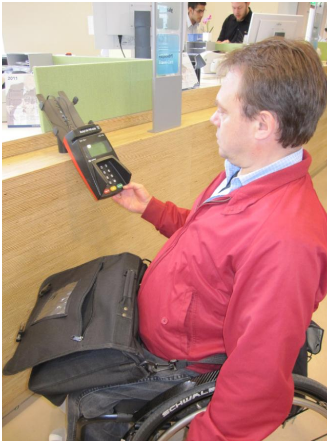
Fig. 26 – Skranke med dankortautomat

Også dankortautomaten ved skranken sidder i en god højde.