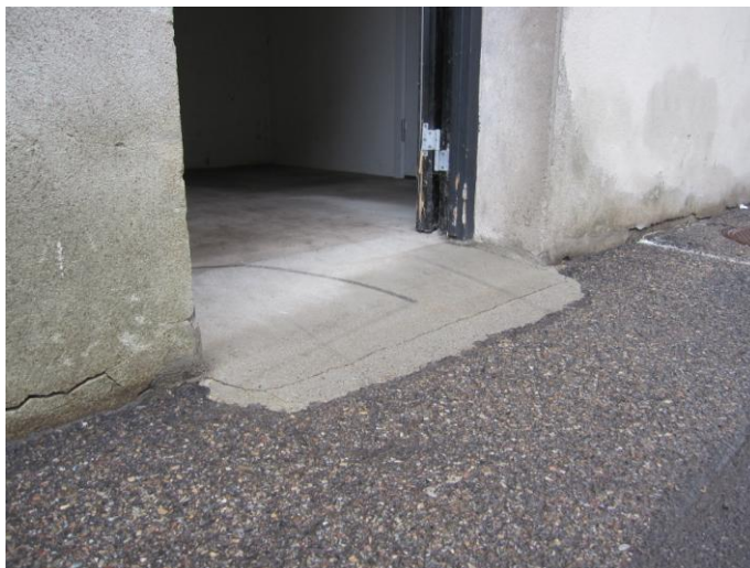
Fig. 9 – Overgang fra perron til lagerrum

Jeg har for fuldstændighedens skyld – og til inspiration – medtaget et billede der viser hvordan det tilsvarende problem i rummet ved siden af elevatorkammeret er løst; et rum der, som jeg forstod det, bliver anvendt som lagerrum.