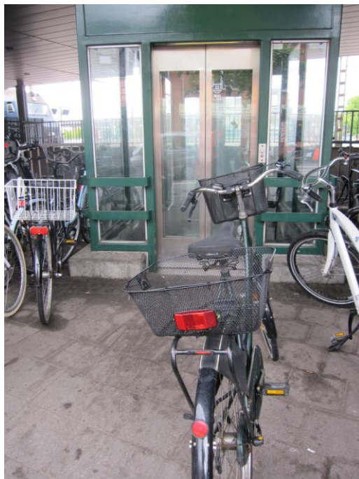
Fig. 21 – Blokering af adgangsvejen til elevator

Der var på inspektionstidspunktet en cykel parkeret foran udgangen til elevatoren – på gadeplan.