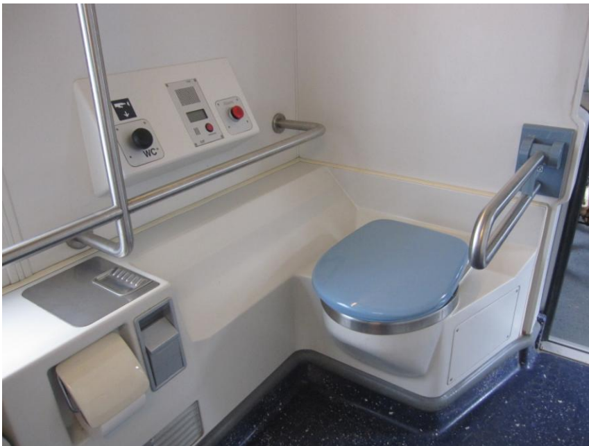
Fig. 15 - Toilethjørnet

Jeg noterede mig især den meget gode plads – også ved siden af toilettet – og de kraftige armstøtter.