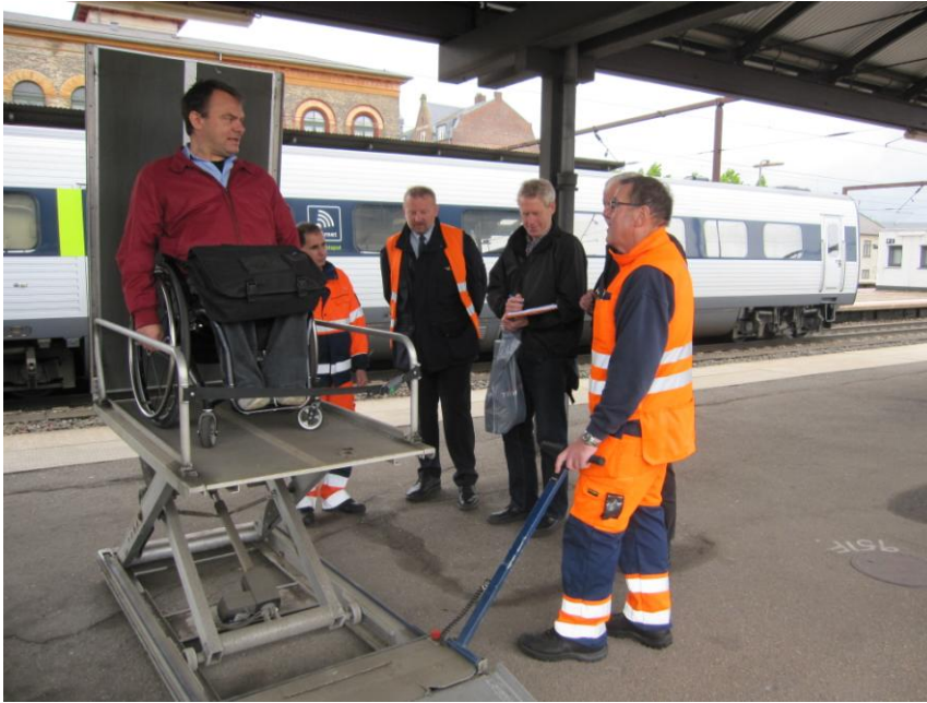
Fig. 14 – Transportabel perronbaseret lift

Heller ikke denne lift, der fungerer trinløst og ved hjælp af strøm fra de medfølgende (løse) batterier, giver mig grundlag for bemærkninger.