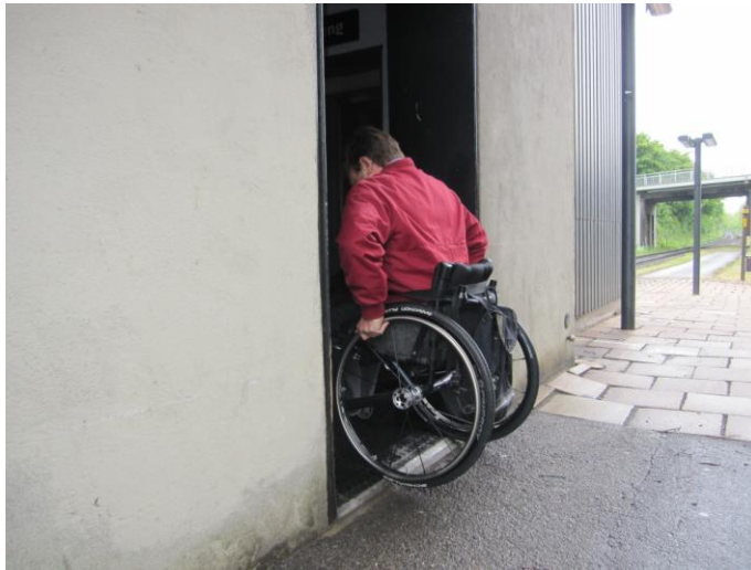
Fig. 8 – Overgang fra perron til elevator(rum)

Det er min opfattelse at den begrænsede tilgængelighed som følger heraf, bør løses.