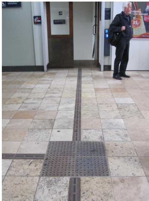
Fig. 5 - Ledelinjer

Der er i gulvet ledelinjer for blinde og stærkt svagsynede. Disse linjer er imidlertid ikke udført konsekvent og er således f.eks. ikke afsluttet med et opmærksomhedsfelt før trappen.