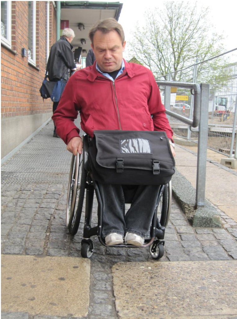
Fig. 3 – Overgangen mellem chausséstén og fortovsfliser

Det synes at fremgå af fig. 2 at såvel fliser som chausséstén er fjernet i forbindelse med den nye rampe og renoveringen af pladsen foran stationen og erstattet af asfalt.