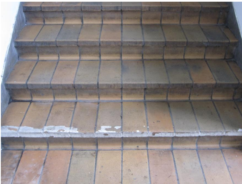
Fig. 6 – Slidt markering af trappeforkant

På trapperne ned til perronerne synes markeringen på trinenes forkant mere eller mindre at være forsvundet ved slid.