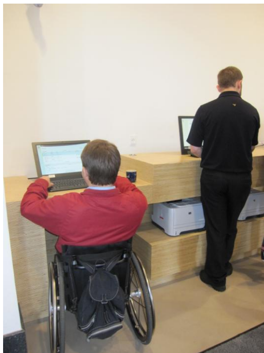
Fig. 25 – Pc-borde i to forskellige højder

Der er en pc i en lavere højde til kørestolsbrugere.