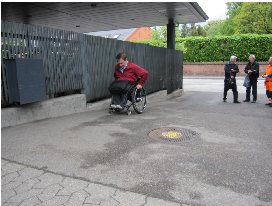
Fig. 22 – Rampe ved stationens vestlige gavl

Den korteste vej fra elevatoren på gadeplan (stationspladsen) og til stationsbygningen og/eller perron 1 bag stationen går via en fast rampe ved stationens vestlige gavl. For kørestolsbrugere der kommer hertil via elevatoren, er dette den eneste vej til perron 1/stationen (medmindre man tager den lange tur forbi stationsbygningen og rundt om tilbygningens østlige gavl).