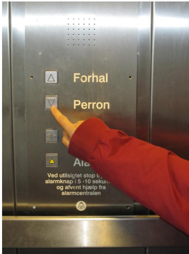
Fig. 7 – Betjeningspanel i elevator

Elevatoren er rimelig stor og har et betjeningspanel i god højde med tydeligt markede, hævede knapper og dertilhørende taktilt fremhævede figurer.