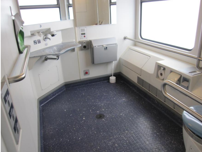
Fig. 16 – Håndlister i hele rummets længde og gode adgangsforhold ved vask

Jeg noterede mig endvidere håndlisterne på væggen til glæde og sikkerhed for gangbesværede, og at håndvasken (og afløbet) er placeret så håndvasken er relativt nem for de fleste kørestolsbrugere at komme ind under.