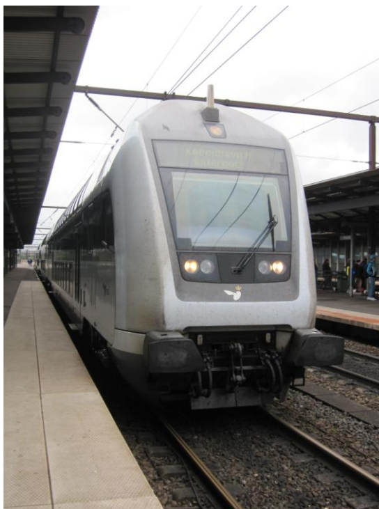
Fig. 11 - Dobbeldækkertog

DSB bruger efter det oplyste under inspektionen i stigende omfang lejede dobbeltdækkertog, også kaldet schweizertog, som erstatning for de forsinkede IC 4-tog.