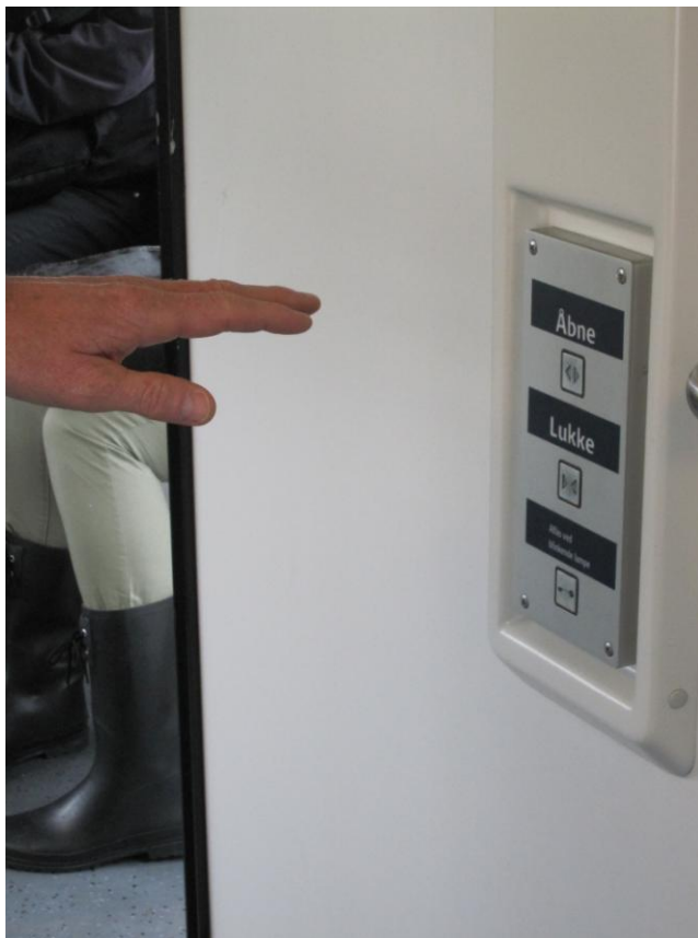
Fig. 18 – Betjeningspanel til dørene

Der var på handiaptollettet fine knapper, også for svagsynede, til aktivering af dørene. Den eneste ulempe er at knapperne – i modsætning til nødkald/alarm knapperne – ikke kan nås fra toilettet.