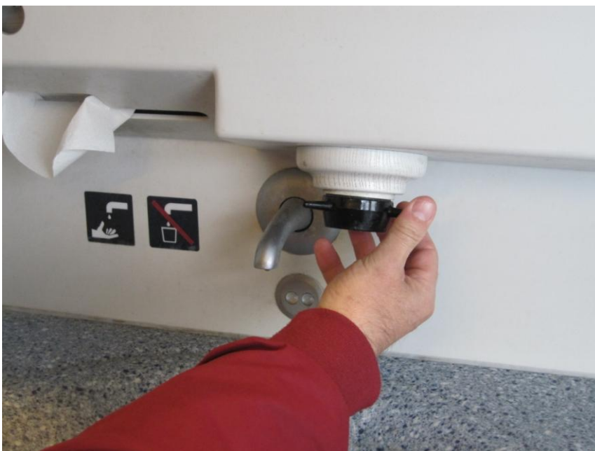
Fig. 17 - Sæbehøvlen

Vandet kommer automatisk (styret af en fotocelle), og sæbehøvlen er forsynet med gode store "vinger".