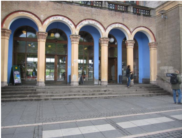
Fig. 23 – Hovedindgangen til Roskilde Station

Fra hovedindgangen er der langt til begge ender af banegården (illustrationen nedenfor viser vejen rundt om stationens/tilbygningens østlige ende).