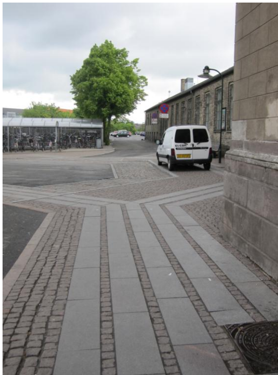
Fig. 24 – Vejen rundt om stationens østlige ende

Fra hovedindgangen er der langt til begge ender af banegården (illustrationen nedenfor viser vejen rundt om stationens/tilbygningens østlige ende).