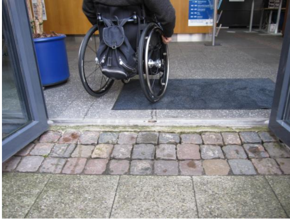
Illustration 7 – Adgang til Borgerservice

Overgangen fra fortovsfliser til dørtrin er fyldt ud med tre rækker store chausséstén.