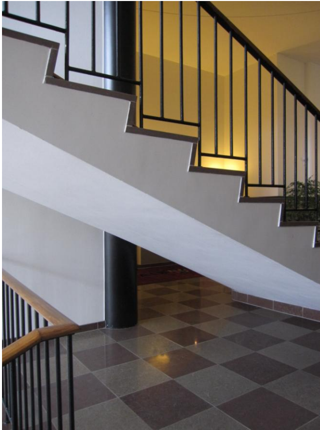
Illustration 4 – Bagsiden af trappen mellem stueetagen og 1. sal

”Af sikkerhedshensyn bør undersiden af fritstående trapper afskærmes, så uopmærksomme personer og synshandicappede ikke støder hovedet mod trappen.”