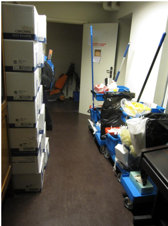
Illustration 5 – Adgangsvej til handicaptollet

Indgangen til handicaptollet opnås gennem et rengøringsrum. På tidspunktet for inspektionen var der – udover rengøringsvogne – placeret et elklaver og et større parti printerpapir i rengøringsrummet.