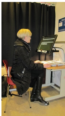
Det særlige forstørrelsesapparat

I ingen af de tre stemmebokse forefandt en filtpen. Ved forespørgsel til stemmemodtageren blev en sådan dog fremskaffet.