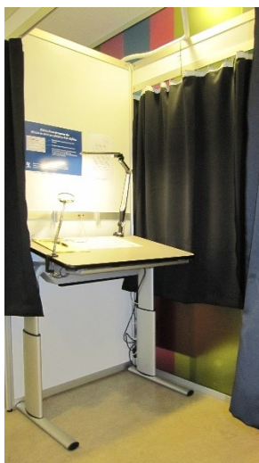
Stemmeboks med hæve-sænke-bord, lup og LED-lampe

LED-lampens lysstyrke og lysfarve skal kunne reguleres af vælgeren. Vælgeren skal desuden kunne ændre LED-lampens placering, således at lysudfaldet kan tilpasses efter vælgerens behov.