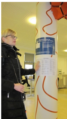
Opslag med kandidatliste

Kommunen skal ved opslag på brevstemmestederne bekendtgøre de godkendte kandidatlistes mv. Jeg henviser herved til § 43, stk. 1, i lov om kommunale og regionale valg.