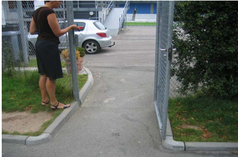
Illustration 7. Indgang for handicappede til de almindelige tribuner

Hver tribune er opdelt med en midtergang som går hele stadionet rundt. Midtergangen er ca. 160 cm bred og er forsynet med klapsæder. Det er efterfølgende oplyst at midtergangen samtidig er flugtvej og derfor alene kan benyttes som adgangsvej for kørestolsbrugere. De steder hvor midtergangen ikke benyttes som flugtvej, vil en kørestolsbruger dog uden problemer kunne placere sig omgivet af sine venner og/eller familie.