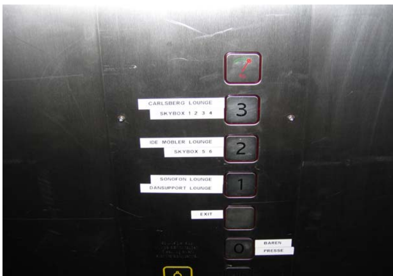
Illustration 4. Betjeningspanelet i elevatoren

Betjeningspanelet i elevatoren er lodret. Panelet sidder i en passende højde midt i elevatoren. Knapperne er nedsænket i niveau med panelet og vil derfor ikke uden videre kunne mærkes af svagsynede og blinde. Etageangivelserne er angivet på knapperne. Etageknapperne lyser når man har trykket på dem.