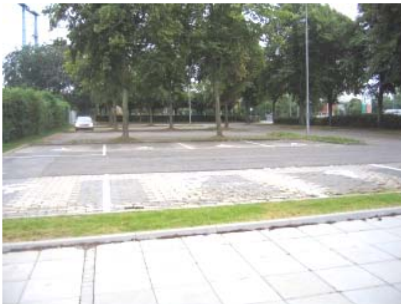
Illustration 1. Parkeringsplads for handicappede

I den foreløbige rapport skrev jeg følgende: