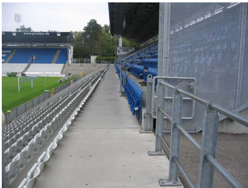
Illustration 8. Midtergangen på en af tribunerne

Hver tribune er opdelt med en midtergang som går hele stadionet rundt. Midtergangen er ca. 160 cm bred og er forsynet med klapsæder. Det er efterfølgende oplyst at midtergangen samtidig er flugtvej og derfor alene kan benyttes som adgangsvej for kørestolsbrugere. De steder hvor midtergangen ikke benyttes som flugtvej, vil en kørestolsbruger dog uden problemer kunne placere sig omgivet af sine venner og/eller familie.