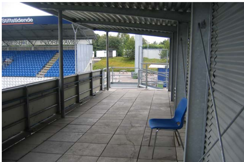
Illustration 5. De overdækkede handicappladser

Nogle kørestolsbrugere vil måske have svært ved at have det fulde overblik ud over rækværket på grund af højden herpå. Jeg fik under inspektionen oplyst at rækværkets højde skyldes sikkerhedsmæssige forhold.