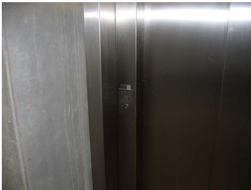
Illustration 3. Elevatorens tilkaldeknop

Det vil for nogle kørestolsbrugere være svært at tilkalde elevatoren på grund af knappens placering inde mellem betonmurene. Selve knappen, hvorpå det angives med lys når elevatoren er tilkaldt, er nedsænket i niveau med panelet og vil derfor ikke uden videre kunne mærkes af svagsynede og blinde.