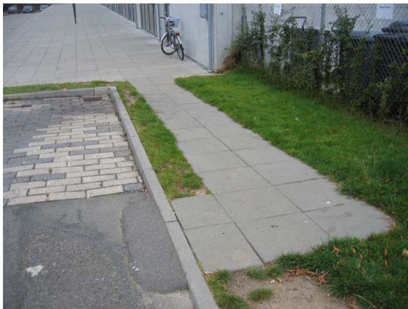
Illustration 2. Opkørsel fra parkeringspladsen

I den foreløbige rapport skrev jeg følgende: