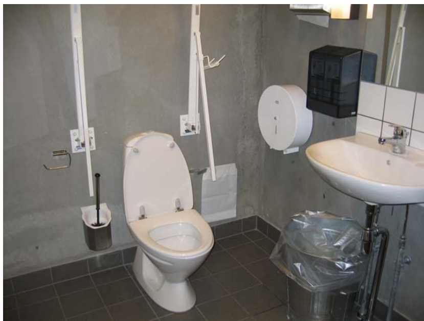
Illustration 6. Handicaptoiletet på 1. sal

Wc'et er udstyret med armstøtter. Wc'et har en højde på ca. 40 cm fra gulv til toiletsæde.